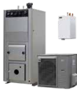
Jäspi Basic Split 8 kW 5360177

sähkökattilan tai energiavaaraajan yhteyteen. Ilma-vesilämpöpumppujen etuna on edullisuus, sillä sen asennuskustannukset jäävät huomattavasti maalämpöpumppua pienemmiksi.