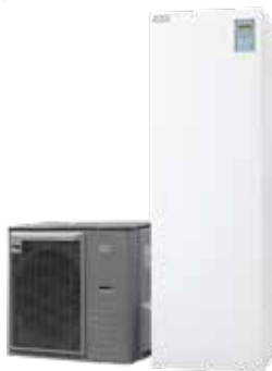
Jäspi Basic Mono 8 kW 5360166

Ilma-vesilämpöpumppu-järjestelmä, joka pienentää energiamäärää ja päivittää lämmitysjärjestelmän nykyaikaan.