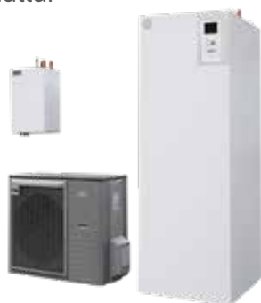
Jäspi Tehowatti Air Split 5058548

Huippuluokan asennus- ystävällistä tekniikkaa eri kokoisiin omakotitaloihin.